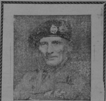
FIELD MARSHAL SIR BERNARD LAW MONTGOMERY,

To finish, may I introduce just one other figure: that of our own killed. In the Burma campaign, which accounted for nearly half the Japanese total army losses of the war, the British Commonwealth had 67,000 killed, a ratio of 7 to 1. In one of the final battles just before the peace the new Tenth Army killed 11,000 Japanese for a loss of 73.